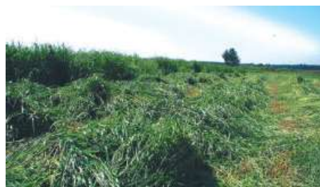
Hierba con mucha hoja